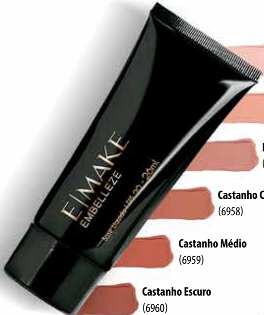
Bege Claro (6955)