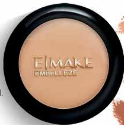
Bege Claro (6967)

Com pigmentos minerais micronizados, permite um acabamento perfeito, uniforme e de efeito natural. Contém Vitamina E.