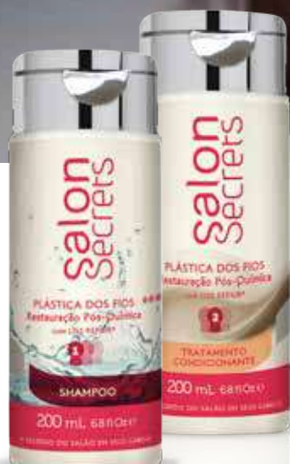
Shampoo 200 ml (5690)