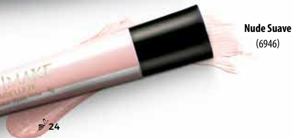
Nude Suave (6946)