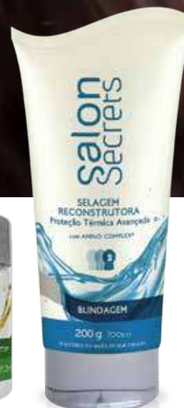
Selagem Reconstitutora 200 ml (5695)