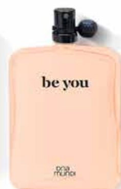
Be You (7079)