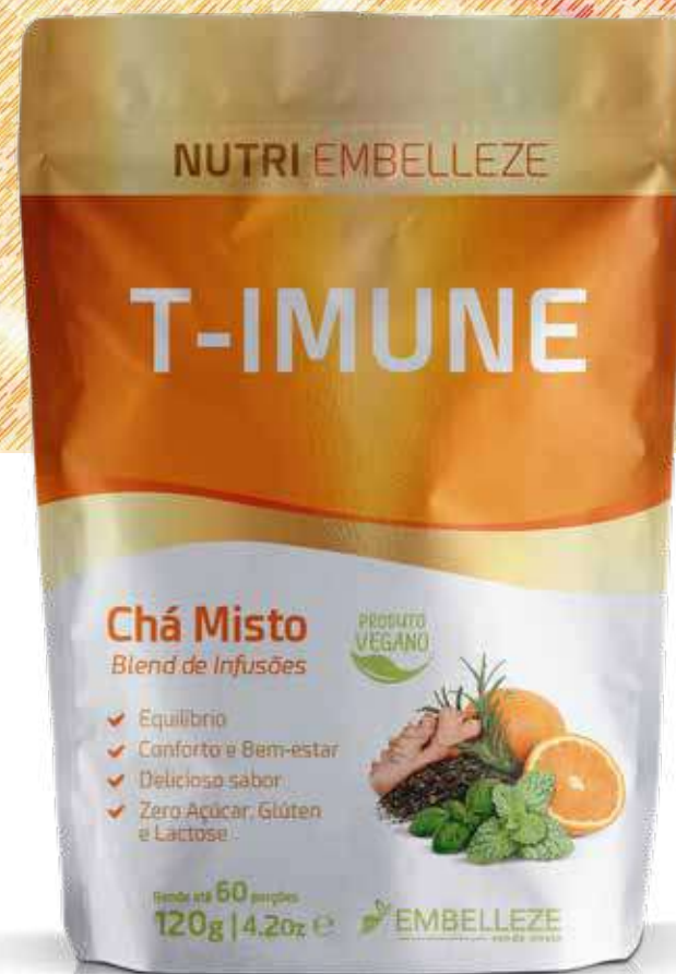
Chá T-Imune NutriEmbelleze 120g (7241)

A combinação das ervas Alecrim, Sálvia, Menta, Manjeriço, Mate Verde e Laranja, ajudam a aumentar e estimular o sistema imunológico, atuando nas bactérias que são nocivas a nossa saúde, melhorando a resposta do nosso corpo a eliminar radicais livres.