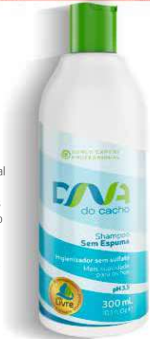
Shampoo sem Espuma 300 ml (6241)

A espuma formada é ideal para que o produto lave delicadamente os cachos preservando a hidratação natural dos cabelos cacheados. Evita o frizz e promove maciez durante as lavagens.