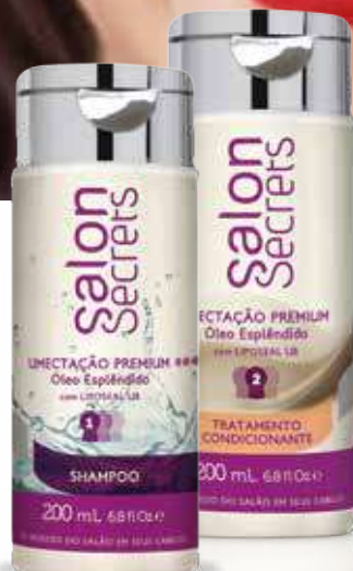
Shampoo 200 ml (5688)