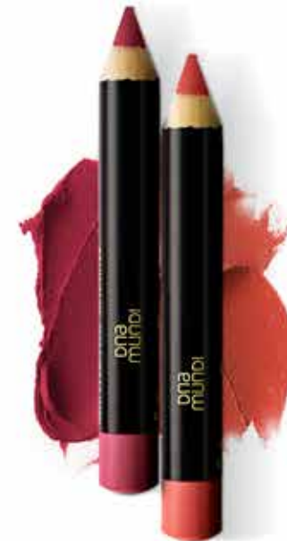
Batom Lápis Matte 2,8 g