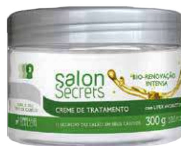
Bio-Renovação Intensa Creme de Tratamento 300 g (5692)