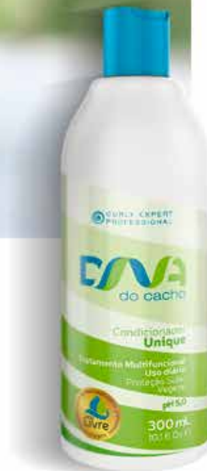
Condicionador Unico 300 ml (5858)

Completo para uma limpeza leve e eficiente, sua função é dar aos fios sua curvatura natural sem a preocupação com componentes que pesem ou dificultem a sua formação.