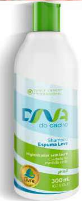
Shampoo Espuma Leve 300 ml (6233)

A espuma formada é ideal para que o produto lave delicadamente os cachos preservando a hidratação natural dos cabelos cacheados. Evita o frizz e promove maciez durante as lavagens.