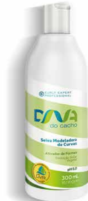
Seiva Modeladora de Curvas 300 ml (6172)

Tratamento multifuncional com Protetor Solar Vegetal. Atua de várias formas no tratamento dos cachos, garantindo modelagem perfeita e a duração da forma. Pode ser usado como condicionador e como creme de pentear.