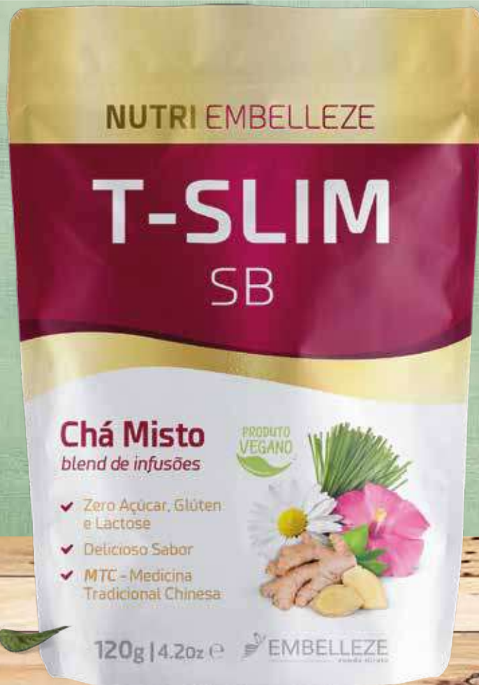
Chá T-Slim SB NutriEmbelleze 120 g (7134)

Inspirado na Medicina Tradicional Chinesa, o Chá T-Slim SB é a combinação perfeita de Sene, Camomila, Capim Limão, Hibisco, Cavalinha, Gengibre e Salsa, que juntas ajudam a acelerar o metabolismo e eliminar toxinas, além de ser um digestivo natural, proporcionando uma sensação única de equilíbrio e bem-estar para uma vida mais leve. Produto vegano. Zero açúcar, glúten ou lactose.