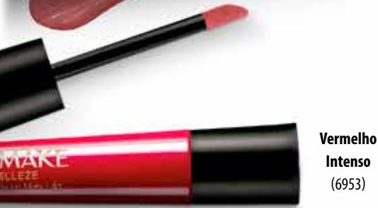
Vermelho Intenso (6953)