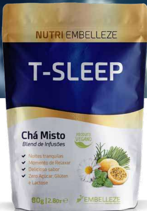
Chá T-Sleep NutriEmbelleze 80g (7240)

A combinação das ervas relaxantes Melissa, Capim Limão, Camomila, Maracujá e Alecrim, induzem a um sono mais profundo e revigorante, proporcionando ao despertar mais disposição e tranquilidade para enfrentar o seu dia.