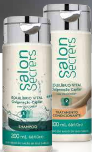
Shampoo 200 ml (5686)

A família Salon Secrets traz os cuidados diários para os cabelos. Cada fórmula guarda os segredos dos profissionais em ativos, fragrâncias e texturas, prontos para rituais de beleza em sua casa.