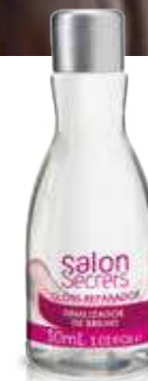
Gloss Reparador 30 ml (5694)