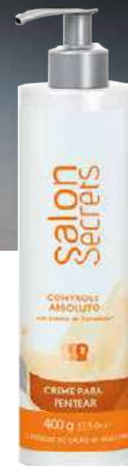
Controle Absoluto Creme para Pentear 400 g (5693)