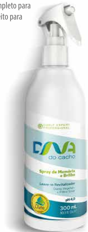
Spray de Memória e Brilho 300 ml (6220)

Ativador de formas com Protetor Solar Vegetal. Ideal para definir, estilizar os cachos e dar um brilho espetacular.