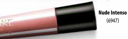
Nude Intenso (6947)