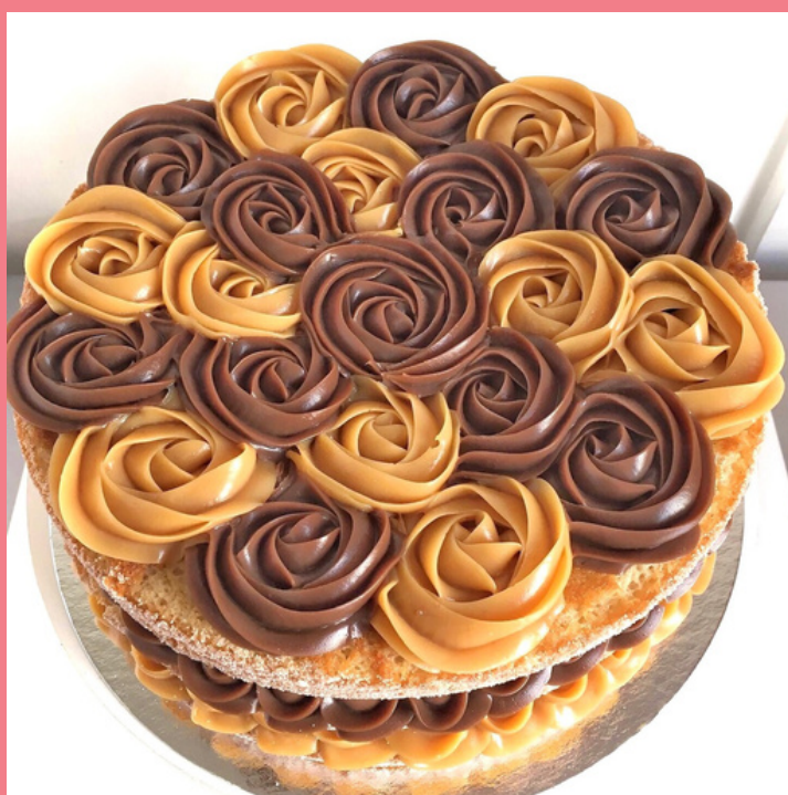
NAKED CAKE CHURROS BOLO BRANCO COM CANELA, RECHEIO E COBERTURA DE BRIGADEIRO TRADICIONAL E DOCE DE LEITE

*PODE SEGUIR O MODELO DE ROSAS (VIDE NAKED CAKE CHURROS)