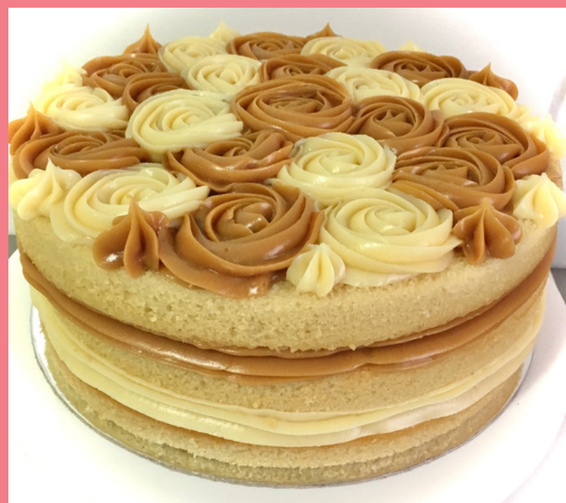
NAKED CAKE DOCE DE LEITE E NINHO BOLO BRANCO, RECHEIO E COBERTURA DE BRIGADEIRO DE LEITE NINHO E DOCE DE LEITE

*AMBOS PODEM SEGUIR O MODELO GOTAS (VIDE NAKED CAKE 2 CHOCOLATES)