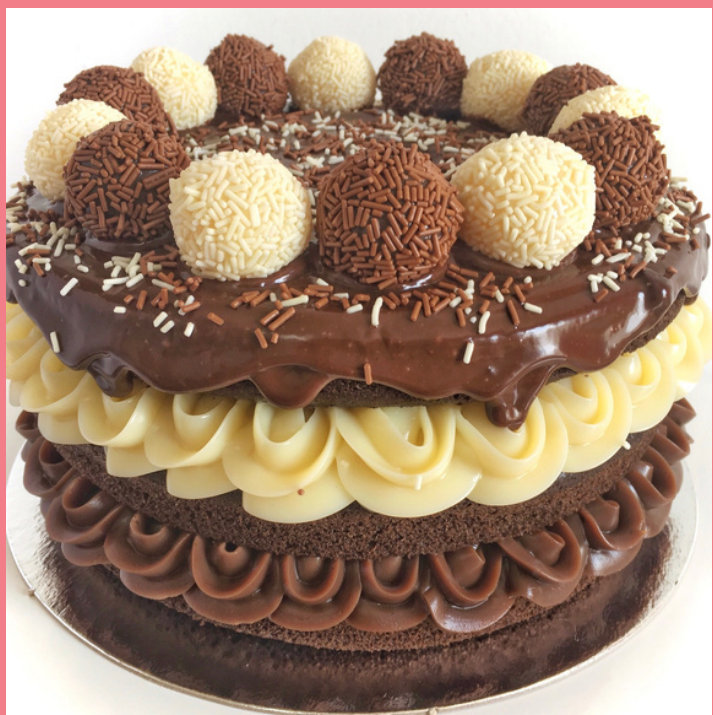
NAKED CAKE BRANCO E PRETO BOLO DE CHOCOLATE COM RECHEIO DE BRIGADEIRO TRADICIONAL E BRANCO, COBERTURA DE GANACHE COM BRIGADEIROS ENROLADOS PRETO E BRANCO