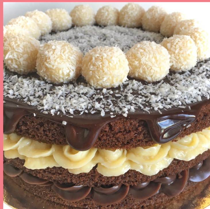
NAKED CAKE PRESTÍGIO BOLO DE CHOCOLATE COM RECHEIO DE BEIJINHO DE COCO E BRIGADEIRO. COBERTURA DE GANACHE E BEIJINHOS ENROLADOS