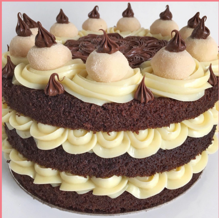
NAKED CAKE NINHO COM NUTELLA BOLO DE CHOCOLATE COM RECHEIO DE BRIGADEIRO DE LEITE NINHO COM NUTELLA