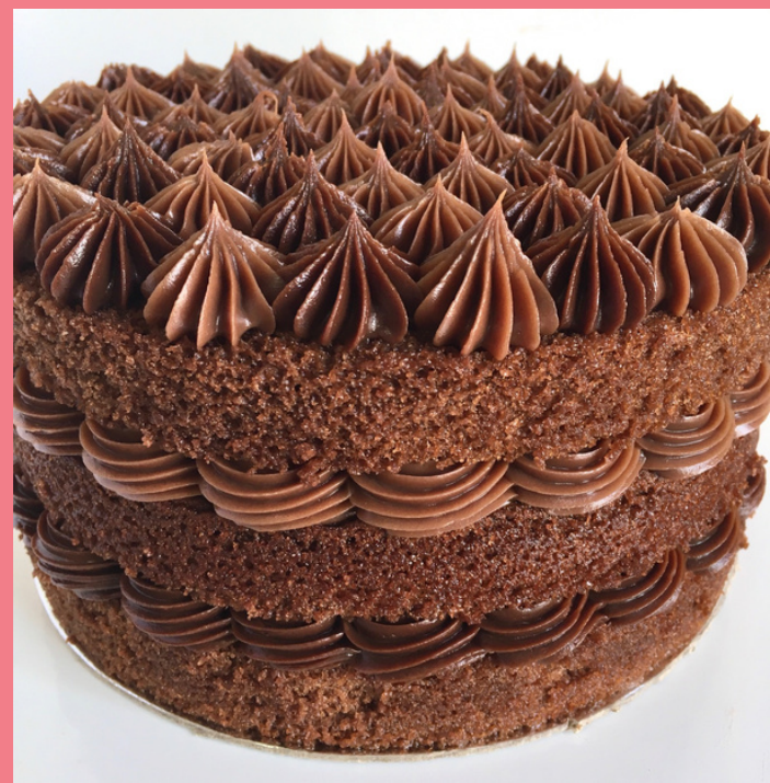
NAKED CAKE 2 CHOCOLATES BOLO DE CHOCOLATE, RECHEIO E COBERTURA DE BRIGADEIRO TRADICIONAL E AMARGO

*PODE SEGUIR O MODELO DE ROSAS (VIDE NAKED CAKE CHURROS)